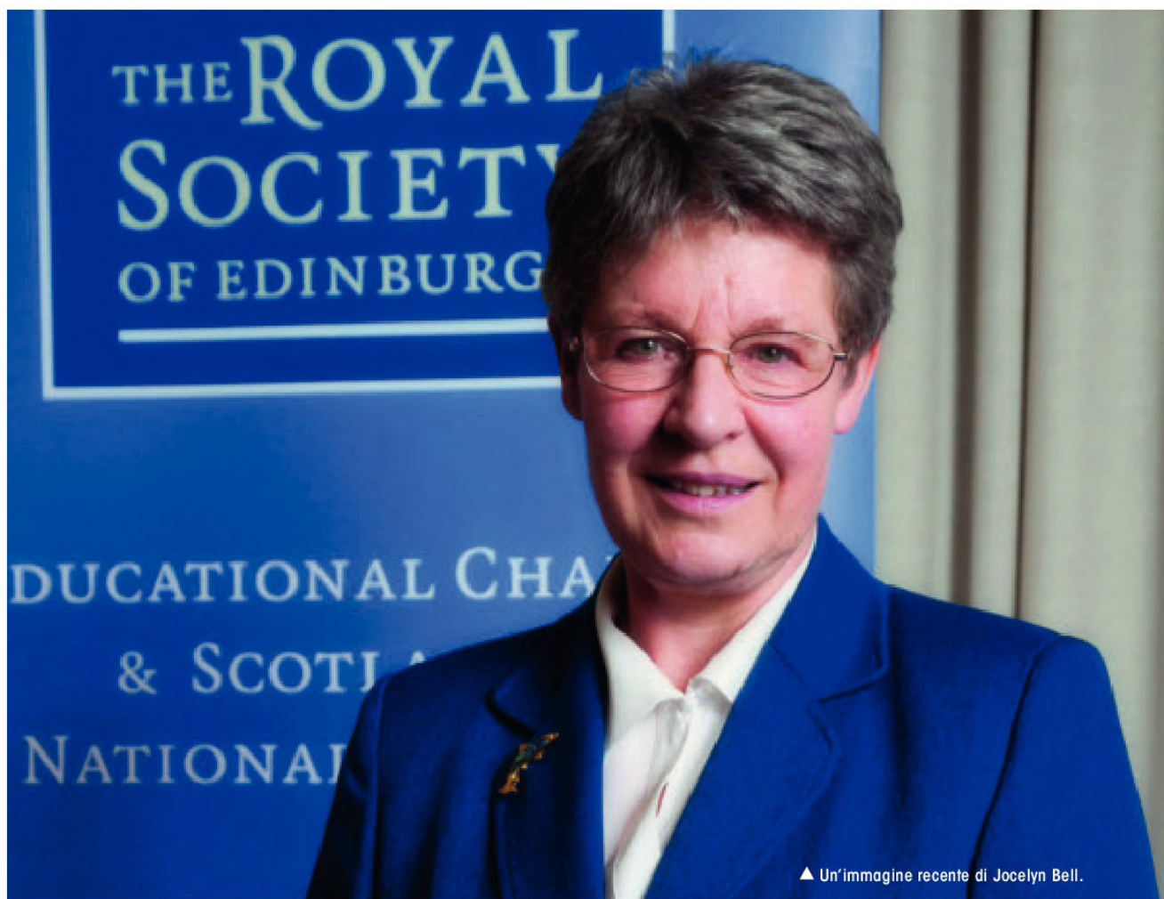
▲ Un'immagine recente di Jocelyn Bell.