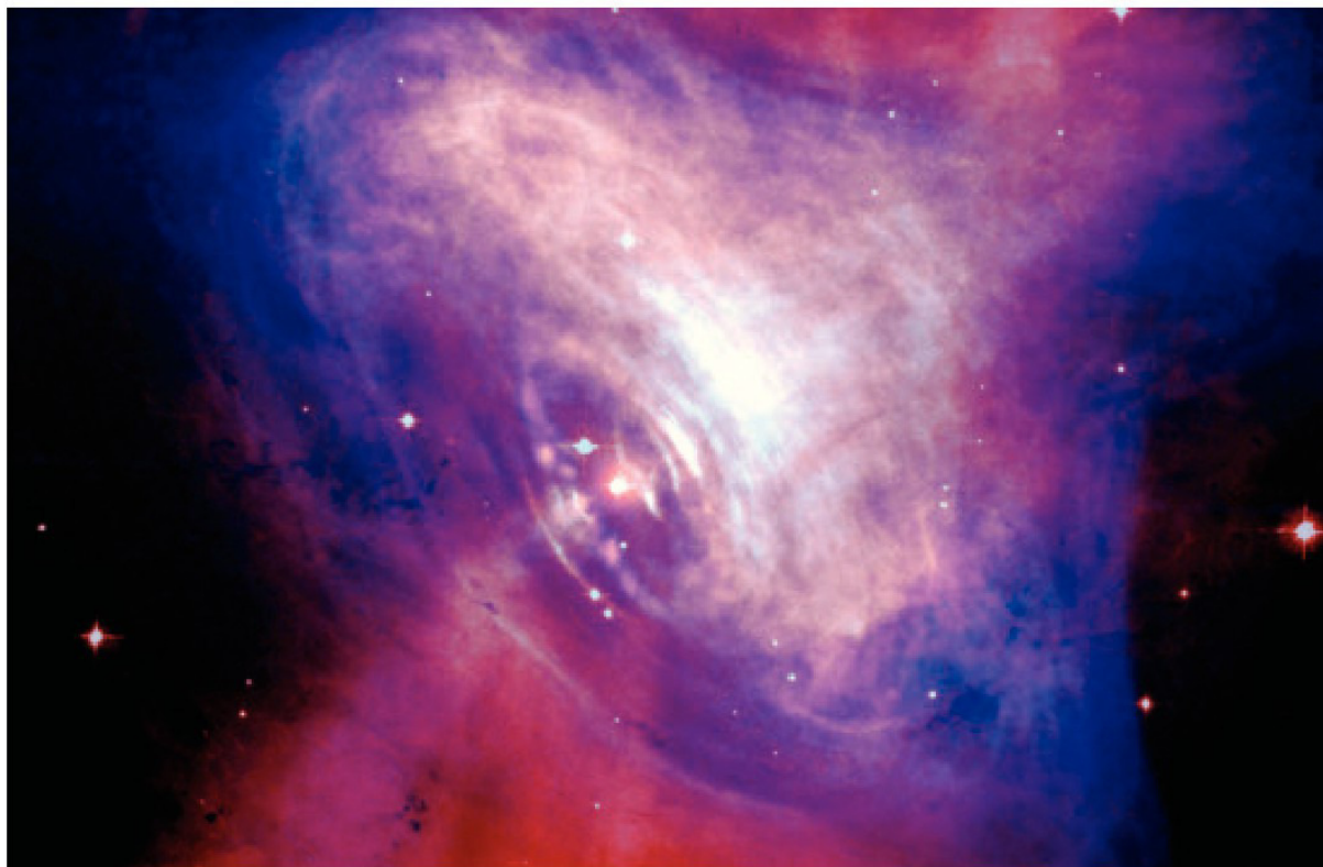
▲ La Nebulosa Granchio (Crab Nebula) è un resto di supernova che nasconde una pulsar, cioè un oggetto del tipo di quelli scoperti dalla giovane Jocelyn. La stella che l'ha originata è esplosa nel 1054.

nane bianche o di stelle di neutroni (mai osservate direttamente prima di allora).