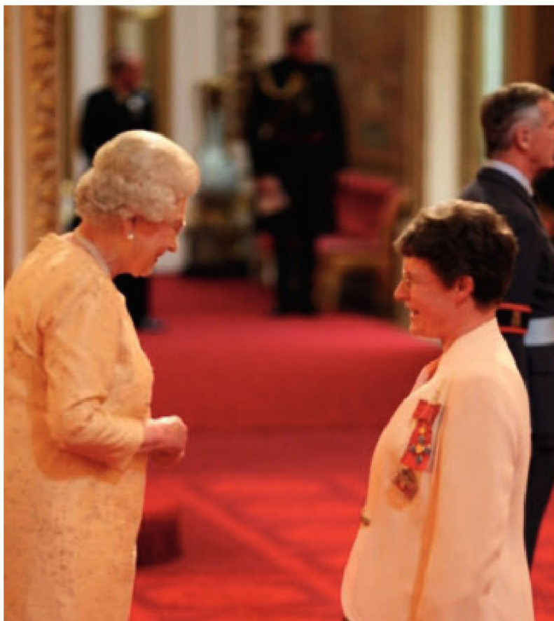
▲ Jocelyn Bell con la Regina Elisabetta II d'Inghilterra durante una cerimonia.

minor frequenza vengono rallentate di più di quelle di frequenza più alta. Misurando il ritardo, Pilkington riuscì ad avere un'idea della distanza: un migliaio di anni luce. Avevano scoperto la prova di una civiltà extraterrestre? Mentre pensavano come e a chi comunicare una scoperta così rivoluzionaria, Jocelyn trovò in una diversa parte del cielo un'altra sorgente pulsante con periodo di 1,2 secondi. Fu la fine della civiltà extraterrestre ma l'inizio della nostra storia. Al ritorno dalle vacanze di Natale Jocelyn trovò altri due segnali che si rivelarono essere pulsati. Era tempo di pubblicare la scoperta. L'articolo intitolato "Observing a Rapidly Pulsating Radio Source" apparve sulla rivista Nature il 9 febbraio 1968 a firma di Hewish, Bell, Pilkington ed altri due membri del gruppo. La scoperta attirò l'attenzione della stampa e fu un giornalista del Daily Telegraph a coniare l'abbreviazione "pulsar" per indicare le ancora misteriose stelle pulsanti. Nell'articolo di Nature , Hewish e il suo gruppo fanno risalire la natura estremamente regolare delle pulsazioni ad oscillazioni di